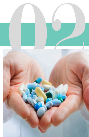
PREVENCE A LÉČBA