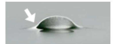
Simulovaná slza* + EvoTears®