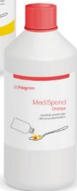
MediSpend Orange 250 ml Doporučená MOC 199 Kč vč. DPH