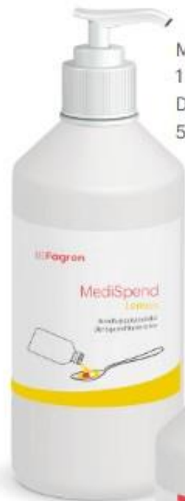
MediSpend Lemon 1 L Doporučená MOC 599 Kč vč. DPH

MediSpend se používá pro zjednodušení podání p.o. tablet nebo kapslí nebo k navlhčení rozdrčených tablet nebo obsahu kapslí. MediSpend je založen na ideálních vlastnostech kukuřičného škrobu. Má lehce viskózní, krémovitou konzistenci a příjemnou citrónovou příchutí, proto je velmi vhodný pro navlhčení léku, které usnadní pacientovi jeho polknutí.